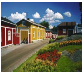
historische Holzhäuser von Alt-Rauma

die Stadt mit den Tammerkostromschnellen und dem Dom Stadtrundfahrt/-gang mit Guide, ab dem Nachmittag Freizeit (zum Museumsbesuch o.ä.)