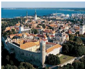
Tallinn, die bunte Stadt am Meer