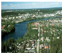
Kouvola mit dem Fluss Kymi

Abendessen in einem noch zu reservierendem Restaurant ( incl. )