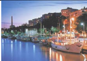
Hafen von Turku