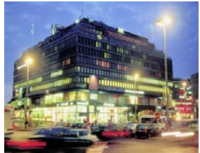
Hotel Sokos Vaakuna