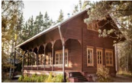
Kaiserliches Fischerhaus Langinkoski