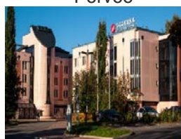
Hotel Sokos Vaakuna Kouvola