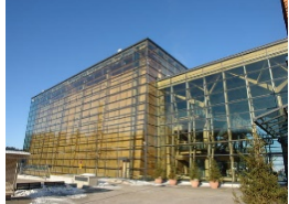
Sibelius-Konzerthaus von Lahti